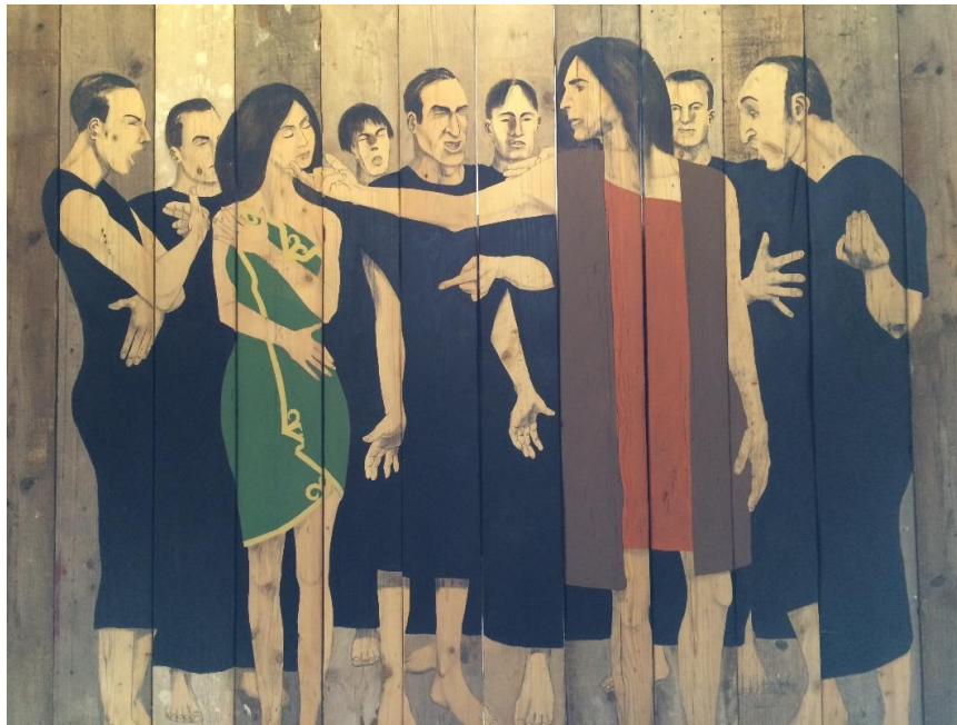
Afbeelding op hout Kathedraal Notre Dame, Straatsburg